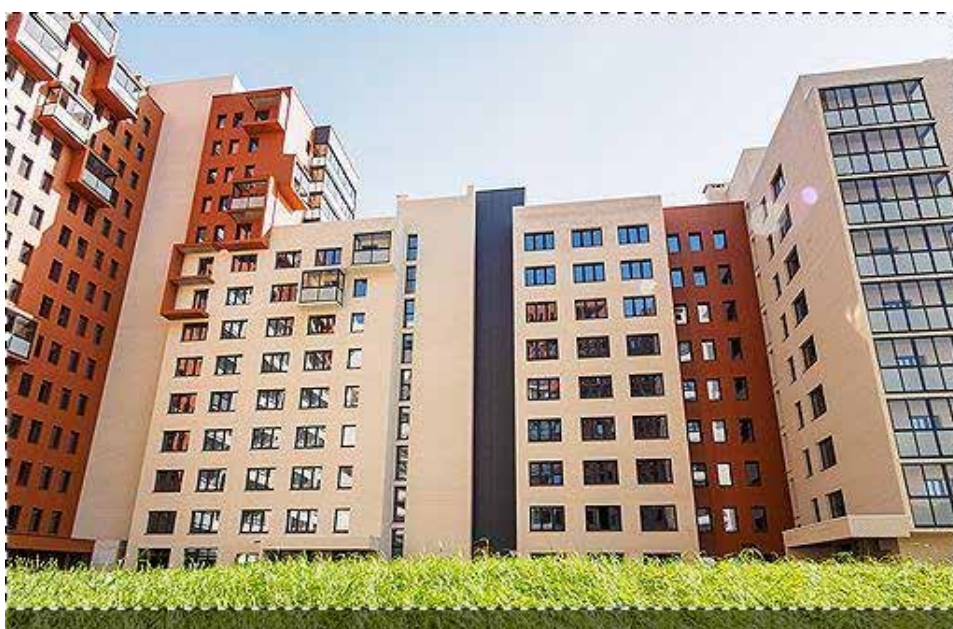
ЖК «Отрада», «Отрада Девелопмент»