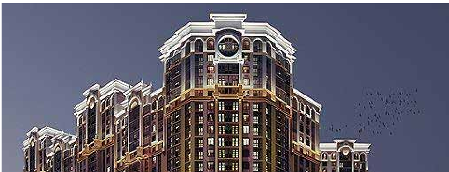
ЖК «Династия», Sezar Group

ботают школы и детские сады, магазины и кафе, торговый центр «Отрада». Есть даже свои пруды с рыбалкой, зоопарк и конный клуб. Авторская архитектура квартала выписана в едином стиле и органично вписана в окружающую природу.