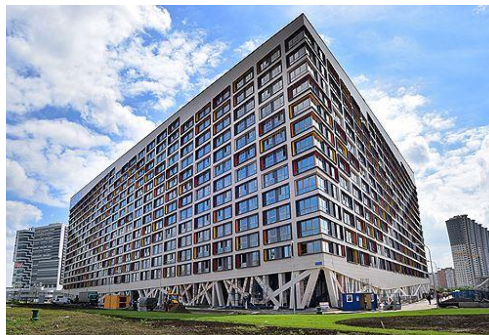
ЖК «Лайнер», ГК «Интеко»