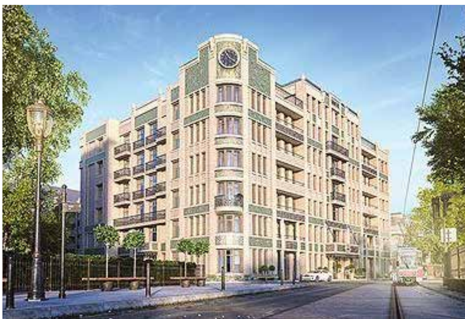
«Резиденция на Покровском бульваре», «Лидер Инвест»

Здесь гармонично объединены комфорт современного мегаполиса и экологическая безопасность. Все дома — монолитно-кирпичные, с подземной парковкой и закрытыми от машин дворами. Комплекс полностью обеспечен инфраструктурой. Причем не в какой-то отдаленной перспективе, а уже сегодня, что является большой редкостью для крупных девелоперских проектов. Здесь ра-